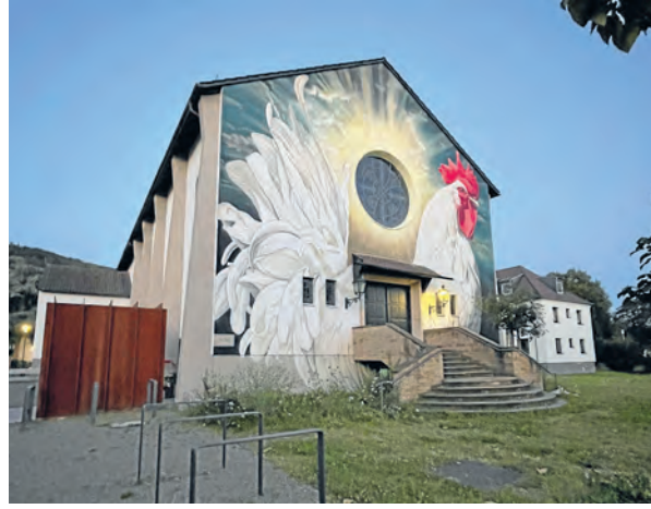
Vom religiösen Raum zum Begegnungsort für den Stadtteil: die Chapel in der Südstadt

Kirchen im Wandel – Flächen gemeinschaftlich nutzen Über Jahrhunderte waren Kirchen zentrale Orte der Stadtentwicklung. Um sie herum entstanden Nachbarschaften, Plätze und ganze Städte. Heute erleben wir hier einen Wandel: Sinkende Mitgliederzahlen und die dadurch veränderten finanziellen Rahmenbedingungen führen dazu, dass die großen Kirchen ihren Gebäudebestand neu ordnen müssen. Diese Entwicklung betrifft auch Heidelberg. Kirchliche Gebäude beherbergen heute Kitas, soziale Einrichtungen, Kulturveranstaltungen und Begegnungsräume. Sie sind sogenannte „Dritte Orte“ – Orte, an denen