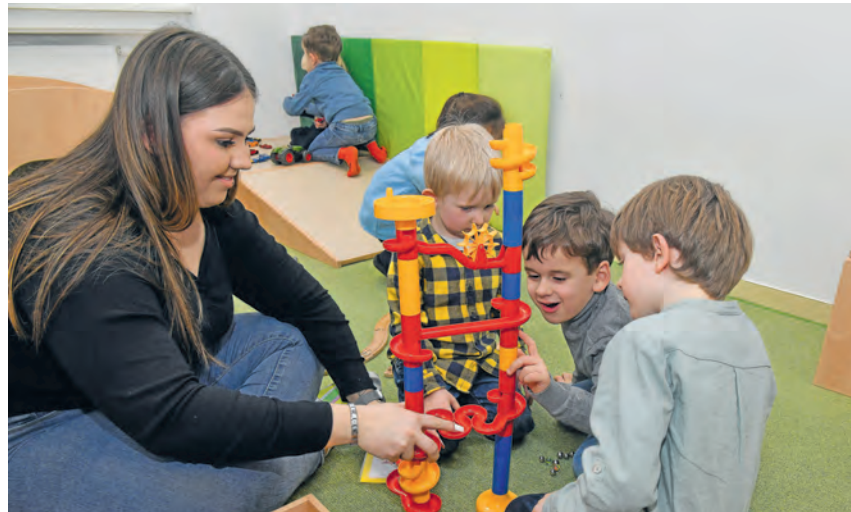
Die Bedarfsplanung zeigt: Für Heidelberger Kinder gibt es auch im kommenden Kindergartenjahr ausreichend Betreuungsplätze in den Kitas.

Im Kindergartenbereich liegt die rechnerische Versorgungsquote im kommenden Kindergartenjahr 2026/2027 bei rund 118 Prozent. Für Kinder im Krippenalter von ein bis unter drei Jahren liegt die Versorgungsquote im Krippenbereich einschließlich Kindertagespflege bei rund 98 Prozent. Davon profitieren die Familien: Kinder bekommen im überwiegenden Fall einen Platz in einer der Wunsch-