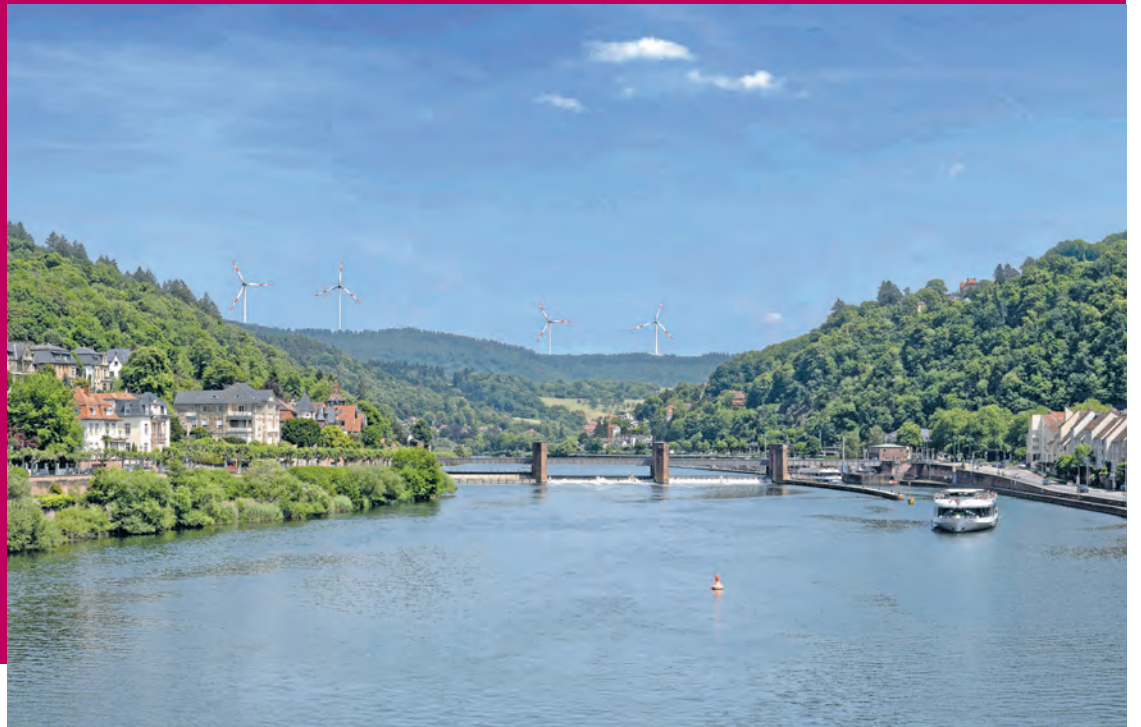
Beim Blick von der Alten Brücke wären vier Anlagen zu sehen. Die Größen der Windräder sind realistisch dargestellt. Farben und Kontraste wurden bewusst verstärkt. (Visualisierung Stadt Heidelberg)

Sonderbeilage mit allen wichtigen Informationen