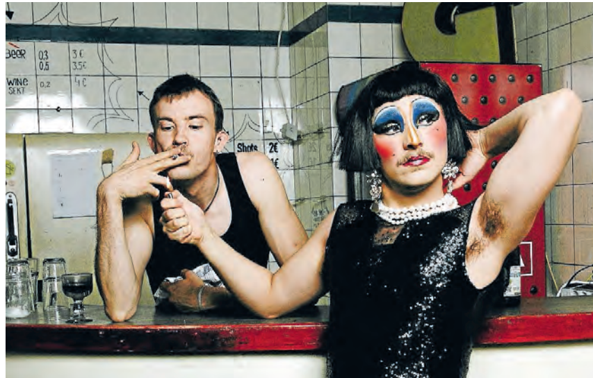
Im Drag-Kabarett „Ich hab’ noch einen Koffer in BaWü“ räumt die Dragperformerin Obertunte liebevoll und schonungslos mit ihrer Heimat auf.

„Für viele queere Menschen sind solche Räume für Repräsentation und freie Entfaltung nicht selbstverständlich. Gleichzeitig richtet sich das Festival an die gesamte Stadtgesellschaft: Es lädt dazu ein, Vielfalt zu erleben, Perspektiven kennen-