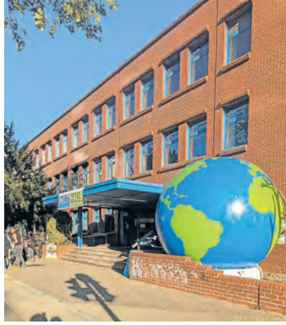
Das WeltHaus Heidelberg hat sein neues Domizil im ehemaligen Zollhaus am Römerkreis gefunden.

Dass das WeltHaus dabei von der Stadt nicht allein gelassen wurde (bei der Suche nach der Immobilie, bei der Renovierung, bei den Kosten), dafür