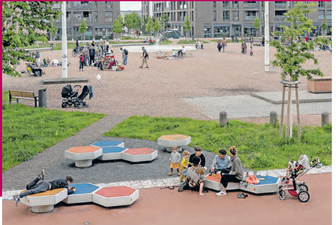
Der Tag der Städtebauförderung fand bereits 2023 in der neuen Südstadt statt. Auch dieses Jahr laden Stadt und Beteiligte aus dem Stadtteil dazu ein, das Quartier zu erkunden.

Führungen, Aktionen, Flohmarkt und mehr am 9. Mai