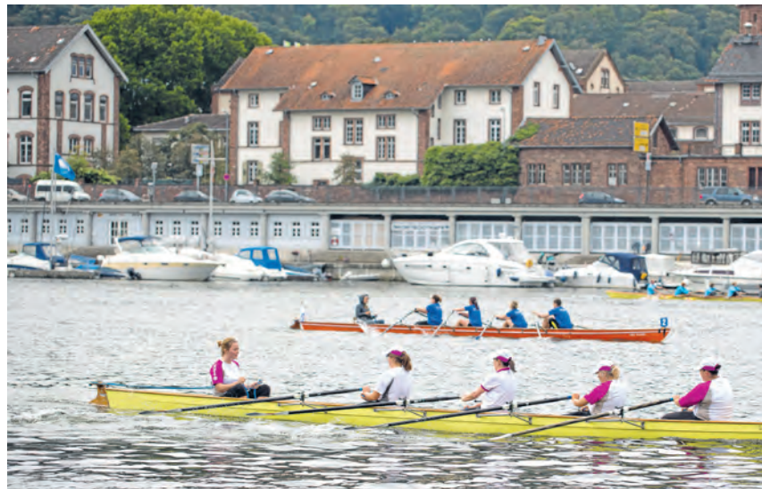
Bei „Rudern gegen Krebs“ werden Spenden gesammelt, um vielen Patientinnen und Patienten die Teilnahme am Projekt „Sport und Krebs“ zu ermöglichen.

Über 40 Vereine bieten am Sonntag, 5. Juli, beim „ Schau fenster des Sports “ von 13 bis 18 Uhr auf der Neckarwiese in Neuenheim Einblick in ihr vielfältiges Sportangebot.