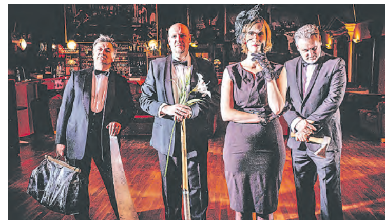
Tutu Toulouse: Freitag, 9. Juli, 23 Uhr, Tiergartenbad