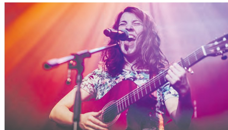
Salma mit Sahne: Sonntag, 18. Juli, 20:30 Uhr, Tiergartenbad