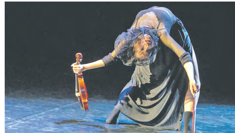
Nostos Tanztheater: 14. Juli, 20:30 Uhr, Uniplatz