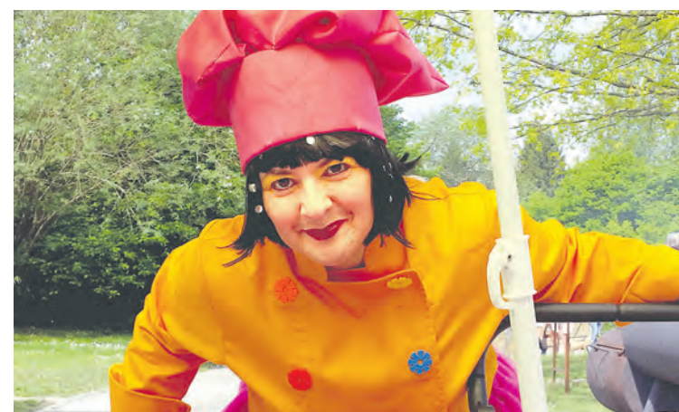
Stracciatella La Bonboniera: Samstag, 10. Juli, 15 Uhr, Kulturtruck Pfaffengrund