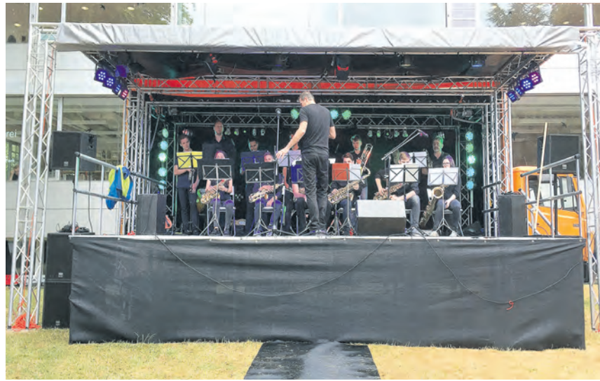
Mit dieser mobilen Bühne kommt der Kultursommer täglich in einen anderen Heidelberger Stadtteil.