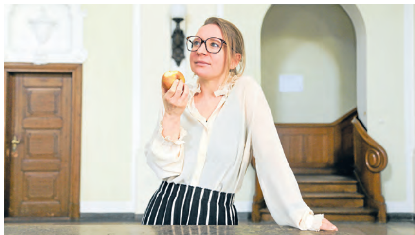
Das Themenjahr „Frauengesundheit im Fokus“ lädt mit spannenden Vorträgen und praxisnahen Angeboten zum offenen Dialog ein.

Diese Veranstaltungsreihe ist gemeinsam vom Amt für Sport und Gesundheitsförderung der Stadt Heidelberg, der Gleichstellungsbeauftragten des Rhein-Neckar-Kreises, der AOK Rhein-Neckar-Odenwald