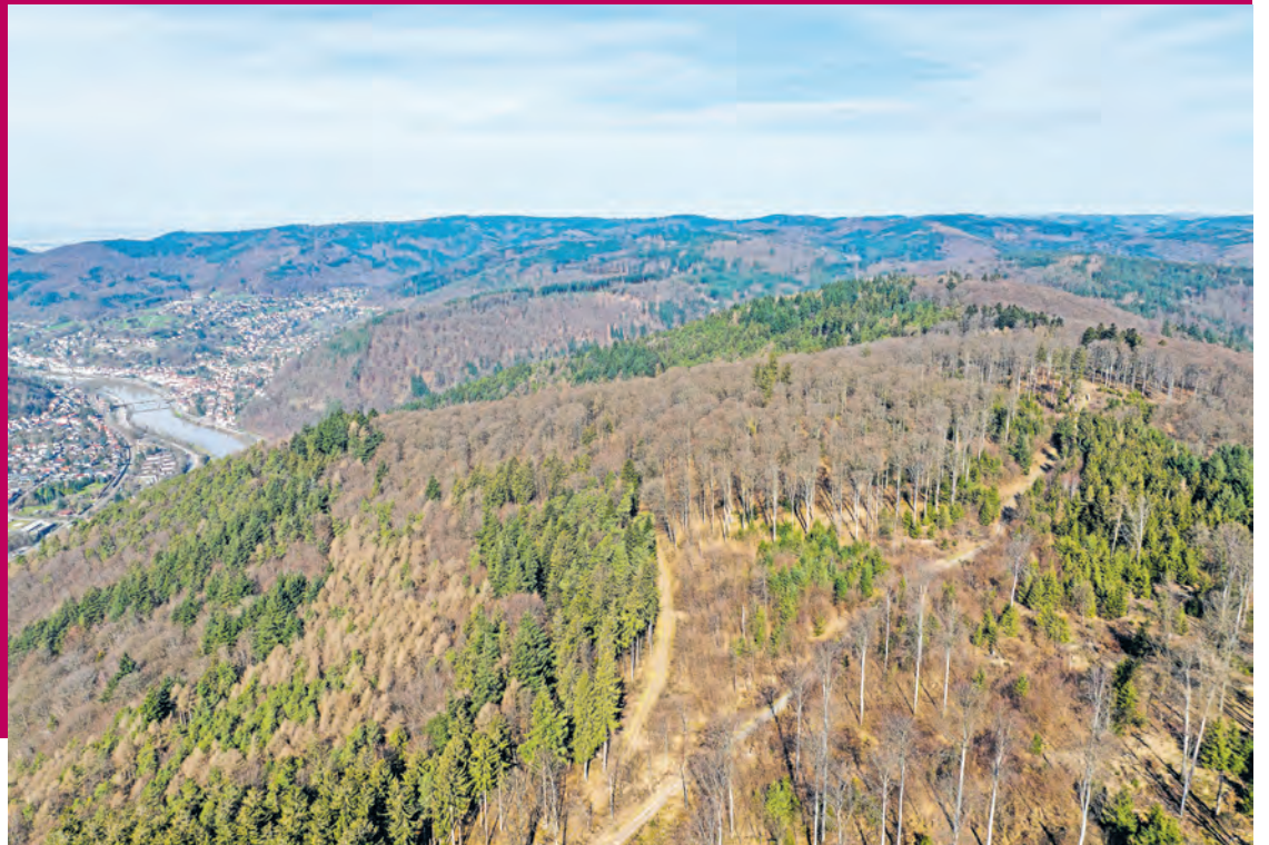
Nach aktuellem Planungsstand geht es auf Heidelberger Gemarkung um bis zu sieben Windkraftanlagen auf dem Lammerskopf.

Abstimmung über Entwicklung des Lammerskopfs als Standort am 12. Juli