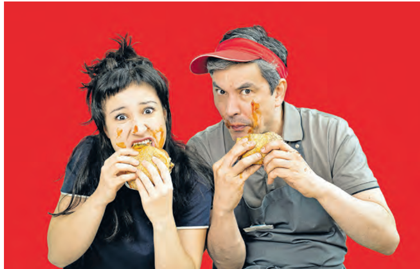
Das Gewinnerstück des „Autor*innenpreises 2025“ wird dieses Jahr nicht nur auf der Bühne zu erleben sein – sondern auch als Hörspielfassung im Radio.

Aus rund 100 Einsendungen hat das Stückemarkt-Team sechs neue Stücke aus dem deutschsprachigen