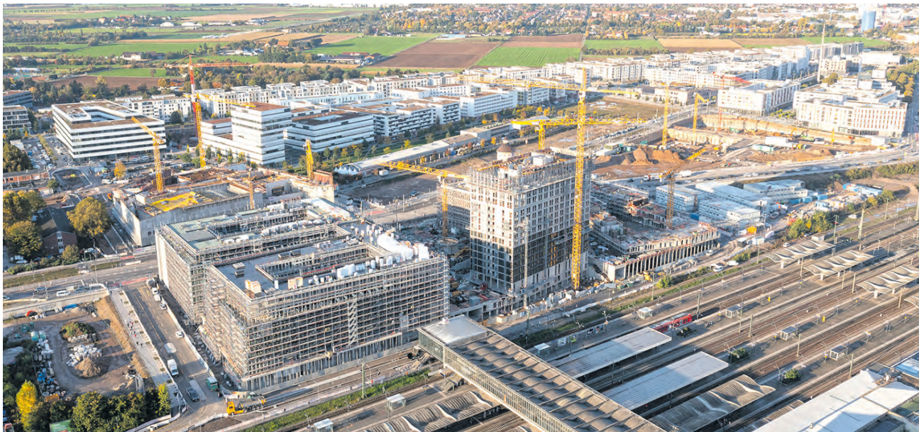
Das neue Quartier am Europaplatz direkt am Hauptbahnhof gehört zur Bahnstadt und bietet einen urbanen Mix aus Wohnungen und Büros, Geschäften, Gastronomie, Hotel und Konferenzzentrum.