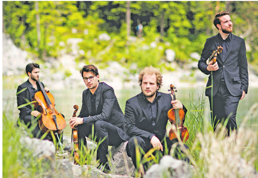
Das Goldmund Quartett ist innerhalb der vier Tage mehrfach zu hören.