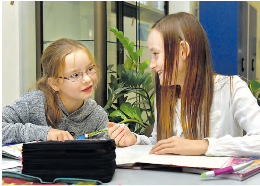
Viertklässler besuchen wieder die Schule, allerdings nur in einem Notbetrieb. Die Stadt Heidelberg würde das Angebot gern erweitern.