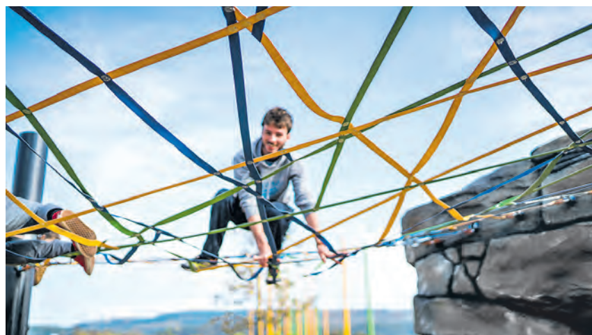
Mit Mindestabstand können Erwachsene und Kinder wieder auf der „alla hopp!“-Anlage spielen und Sport treiben.

Die Stadt wird ihre Sporthallen zum 2. Juni wieder öffnen: Sie hat sich