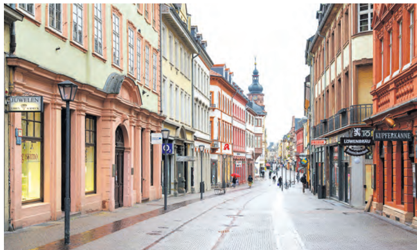
Leere Straßen, geschlossene Geschäfte, null Umsatz: Unter anderem bei der Gewerbesteuer erwartet die Stadt deutliche Einbußen.

„Wir wollen noch vor der Sommerpause gemeinsam mit dem Gemeinderat besprechen, welche Projekte wir fortsetzen können und welche geschoben oder auch gestrichen