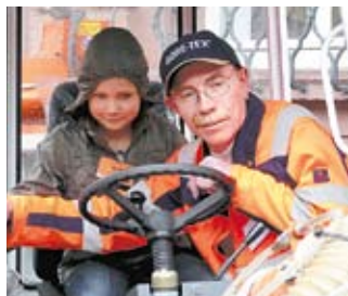
Abfall entsorgen ist spannend.