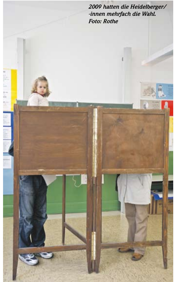
2009 hatten die Heidelberger/-innen mehrfach die Wahl.

Der Gemeinderat hat am 22. Oktober insgesamt 15 Mitglieder in den Beirat von Menschen mit Behinderungen (bmb) berufen. Neue