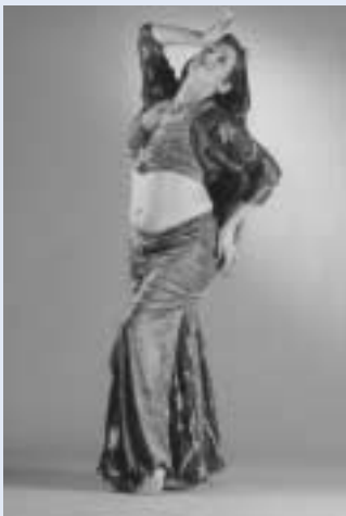
Orientalischer Tanz: „Suleika Sisters“