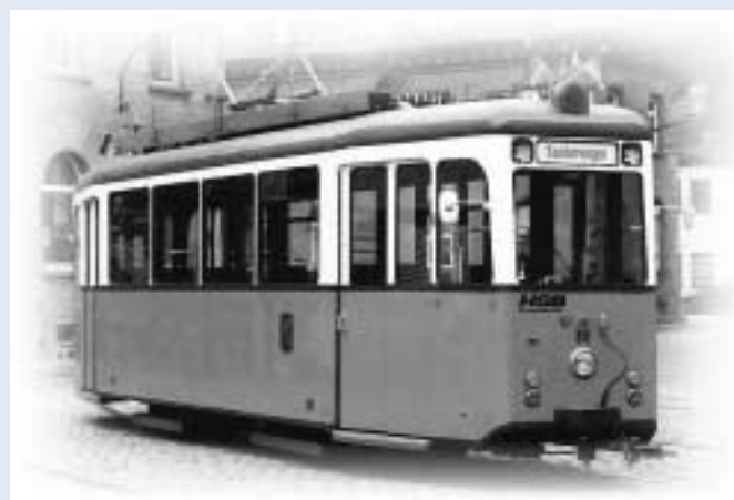
Der über 40 Jahre alte Straßenbahnwagen TW 80 der HSB