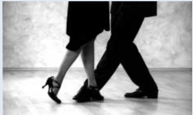
Ausdrucksstark und emotional: Tango, vorgeführt von der Heidelberger Tanzschule „Conde Tango“

Wir danken den Sponsoren und allen Geschäften der Brückenstraße für ihr Engagement!