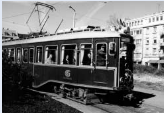
Der Salonwagen der OEG, gebaut 1928 von der Waggonfabrik Fuchs